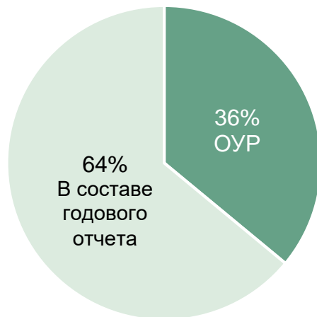
за 2021-ый отчетный год